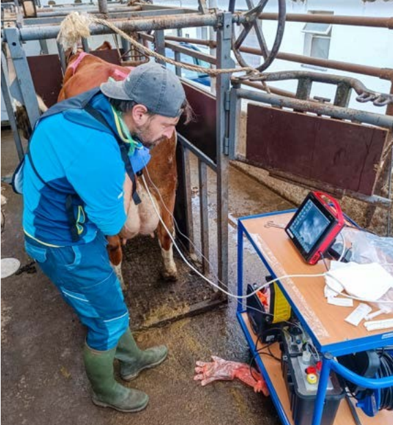
Plemence musí být při odběru umístěna do fixační klece a celý proces aspirace vajčček se kontroluje přes monitor ultrasonografu

Teplota prostředí je naprosto zásadní faktor, který ovlivňuje životaschopnost získaných vajčček. Jsou totiž velmi teplotně sensitivní, a proto by měla být teplota okolí při aspiracích udržována minimálně na 15 °C.